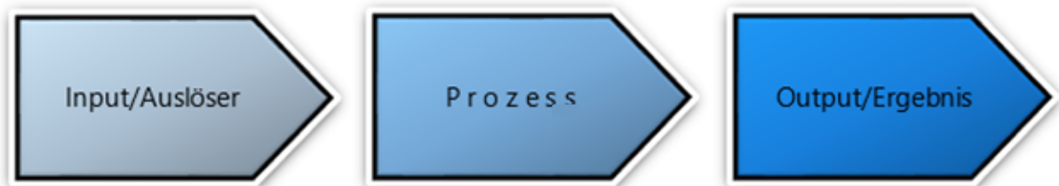
Abbildung 2: Prozessaufbau.

Unter einem Prozess wird die Folge logisch zusammenhängender Aktivitäten zur Erstellung einer Leistung oder Veränderung eines Objektes (Transformation) verstanden. Ein Prozess hat einen definierten Anfang (Auslöser, Input) und ein definiertes Ende (Ergebnis, Wert, Output). 1